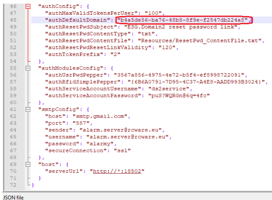
Obr. č. 3 Kopírovaný kód z appsettings.json

Ve složce Merbon User Policy klikneme pravým tlačítkem na záznam v registru s názvem: „Default Domain“ a vybereme možnost „Změnit“. Objeví se nám okno pro úpravu řetězce. Zde do pole „Údaj hodnoty:“ vložíme kód, který najdeme v zkopírovaném souboru appsettings.json. Soubor otevřeme v editoru textových souborů (nejlépe notepad ++ apod.). Řetězec, který hledáme, se nachází na řádce začínajícím "authDefaultDomain" (viz obrázek).